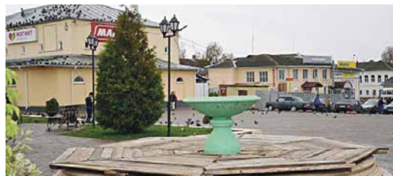
► ...на смену которому пришел сейчас уже демонтированный фонтан.