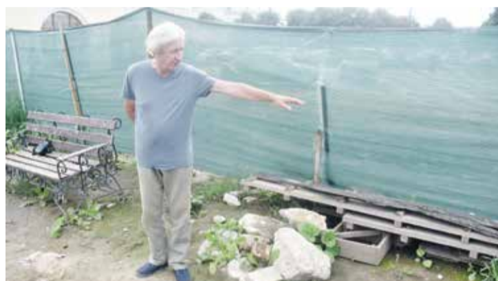
► Раскопки на площади ведет археолог РАН Олег ПРОШКИН.

ном на данном участке. Но фонтан к нему никакого отношения не имеет — это объект благоустройства, не более того. За работами осуществляется очень серьезный надзор, поскольку они выполняются за федеральные средства, а сам проект был одобрен региональным Отделом по охране культурного наследия, — отвечает Бодрова.