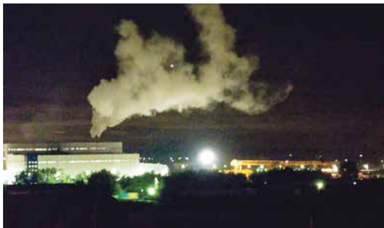
► «Будущее» дымит и днём, и ночью.