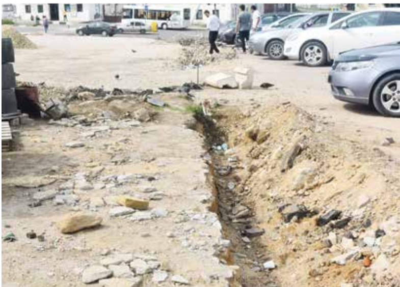
► Одним из ключевых элементов благоустройства станет перенос ЛЭП под землю.

Конфликт вокруг этих останков уже также можно считать частью истории Боровска. Каждый мэр города пытается проводить на центральной площади какие-то работы, которые наталкиваются на сопротивление активистов, и здесь опять же попенять можно обе стороны. Казалось бы, чиновники могли бы уже оставить территорию в покое, ведь участок, нуждающийся в благоустройстве, в городе хватает. Но с другой стороны