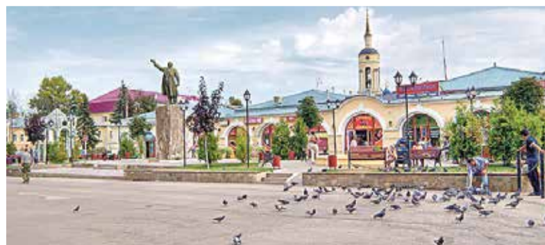
► Не все боровчане помнят, что когда-то на площади стоял памятник Владимиру Ильичу...

К слову, то же самое касается и булыжной мостовой, которая в свое время также стала предметом жар-