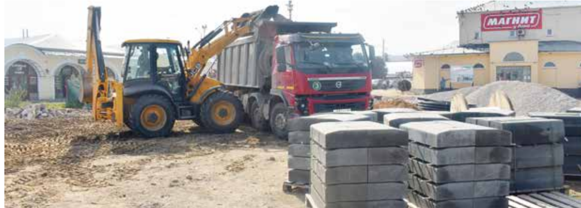
► Работы идут полным ходом — закончить первый этап подрядчик должен уже в сентябре.

— По проекту под фонтан планируют закачать 25 кубометров бетона и наступит такое время, когда придется отвечать за нарушение закона, и этот объект придется демонтировать. Есть 73-й федеральный закон, который запрещает капитальное строительство на объектах культурного наследия. Этот вопрос мы поднимали раньше, поскольку, когда еще шло обсуждение проекта, фонтан должен был быть в разы больше. Мы не против этого объекта как такового, но пусть он будет надземным, без многотонного основания, — расска-