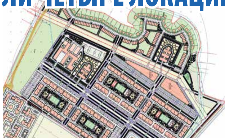
► Мастер-план для участка 60га.

Комплексная застройка появится и на других пустующих сегодня участ-