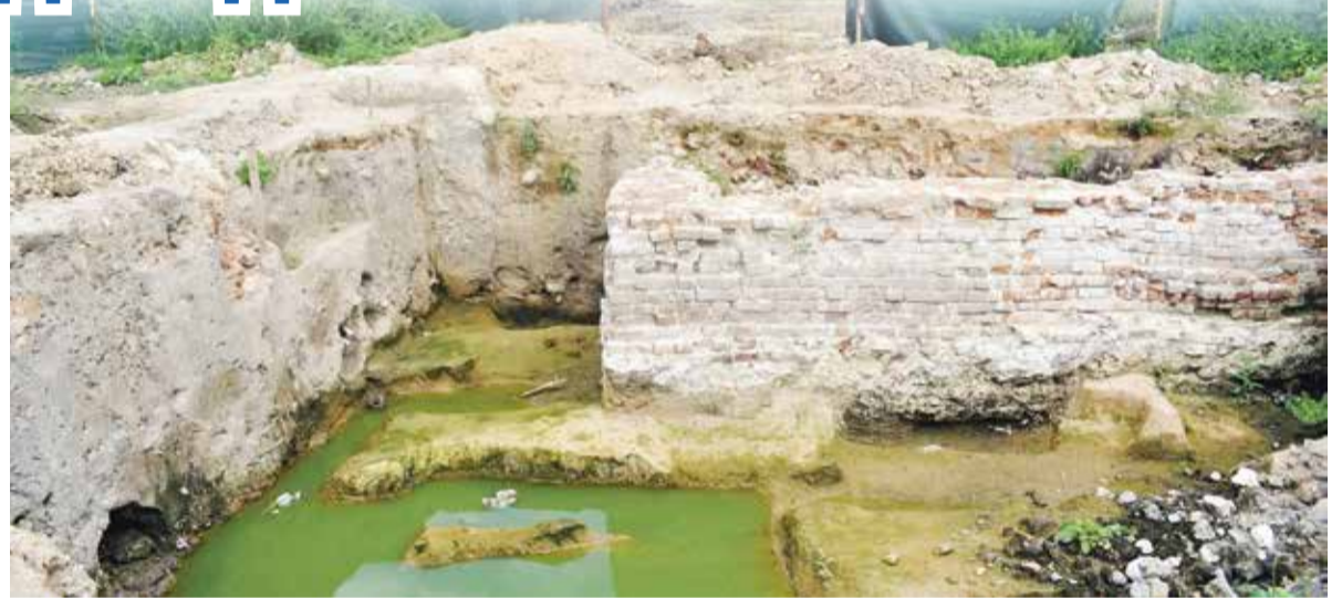
► В ходе раскопок на площади обнаружили часть стены церковной лавки и захоронения 17-го века.

Центральная площадь тому прекрасный пример. В принципе, ничего удивительного в том, что администрация хочет освежить и навести лоск на «лице» города нет.