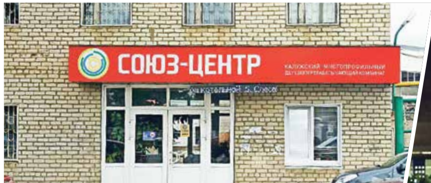
► Несмотря на то, что «Союз-Центр» остаётся главным потенциальным «загрязнителем»...