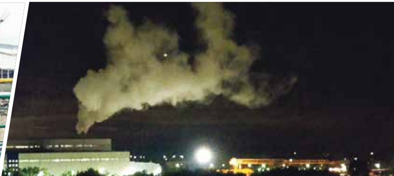
► ...в последнее время балабановцев куда больше беспокоит ситуация на улице Южной.