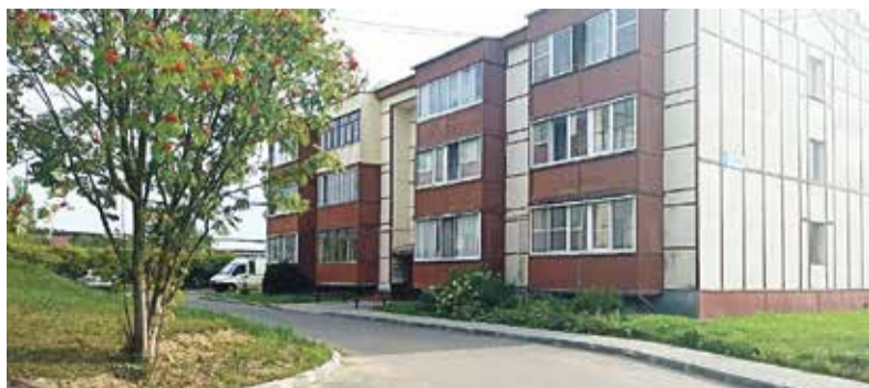
► Благоустройство дворов в Балабанове прошло без серьезных проблем, чего не скажешь о дорожных работах.