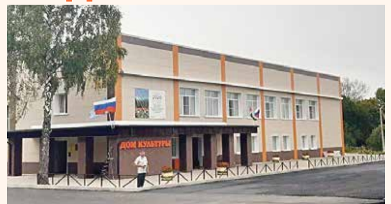
► Благоустройство территорий в МО СП Деревня Людково

— За каждым объектом закреплены кураторы из депутатского