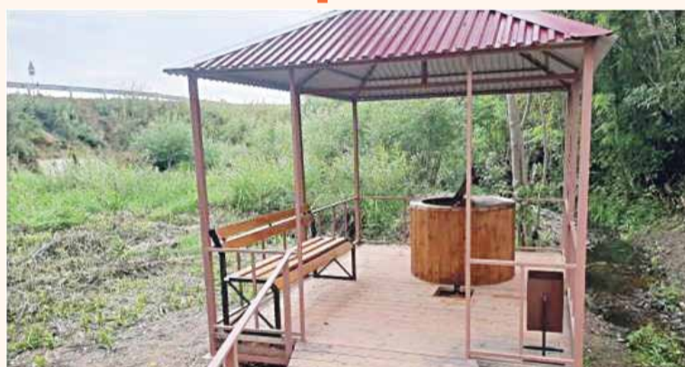
► Благоустройство родника в д Речицы