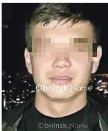
► Предполагаемый виновник в смерти обнинца