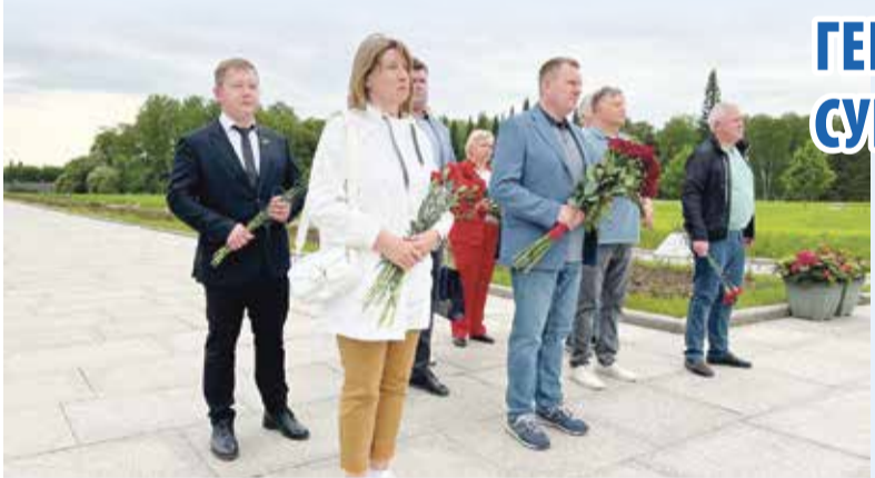
► Калужская делегация возложила цветы к монументу

Комитеты двух парламента — Калужской области и Санкт-Петербурга займутся разработкой законодательных инициатив на основе опыта работы регионов. Об этом договорились спикеры Геннадий Новосельцев и Александр Бельский в ходе визита калужской делегации в Северную столицу.