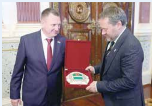
► Геннадий Новосельцев встретился с Председателем Законодательного Собрания Санкт-Петербурга Александром Бельским

В текущем году празднуется 350-летие со дня рождения основателя Санкт-Петербурга Петра Великого. Цветы от калужан были возложены также к могиле великого реформатора и патриота России.