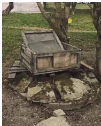
► Балабаново. Канализационный колодец на улице Дзержинского с ящиком «для сбора средств» на люк (18.04.2023).

Напомним, что на прошлой неделе работать с данной ресурсоснабжающей организацией начали по-новому, поскольку сотрудники ЕДДС постоянно жалуются на отсутствие обратной связи с местным отделением организации. Вообще, подобных претензий у диспетчерской службы накопилось изрядно — то в водоканале не выходят на связь, когда до них пытаются дозвониться после обращений жителей, то не доносят информацию о том, что работы были проведены. Но самое «любимое» — это неготовность предприятия заниматься ремонтом в выходные дни. И в случае аварии бригаду для ее устранения приходится ждать до понедельника.