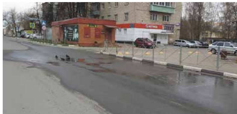
► Балабаново. Потоп на ул. Гагарина. (18.04.2023)