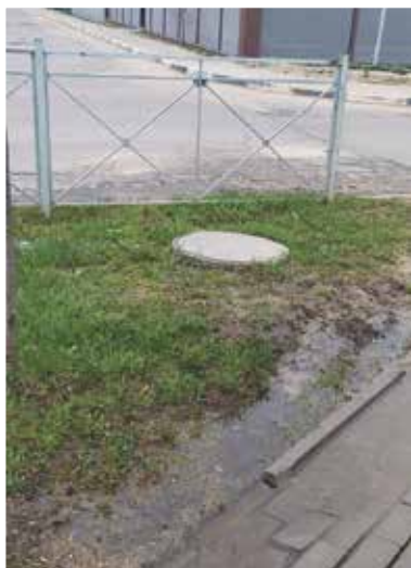
► Балабаново. Порыв на ул. 1 Мая длиной в неделю. (18.04.2023)

Тем не менее, пускать ситуацию на самотек в районе не намерены, и следующим серьезным шагом по выстраиванию продуктивных взаи-