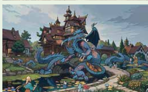
► Узнали Боровский район?