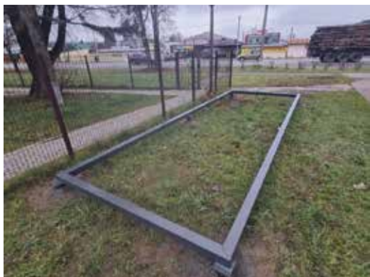
► В сквере «Городской» туалет так и не появился, но ещё, говорят, появится.

В 2022 г. на берегу Страдаловки благоустроили зону отдыха «Дивный берег», и для удобства отдыхающих установили модульный туалет. Буквально в считанные дни его закидали камнями и изгадили внутри. После этого уже сами жители города стали предлагать сделать туалет платным и даже установить внутри видеокамеры. Но до этого дело, конечно, не дошло — туалет, хоть и работает только в тёплый период года, но всё же остаётся бесплатным.