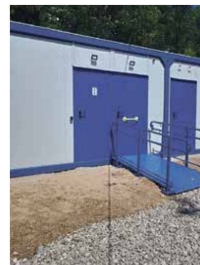
► Туалет на Дивном берегу работает только в тёплый период года, зато бесплатно.