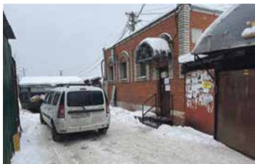
► Самый старый туалет в г. Балабаново доступен за 25 р.