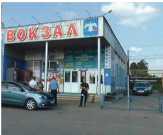
► В 2018 г. статус вокзала у здания на привокзальной площади отменили. Теперь это обычный торговый центр с залом ожидания.

Да, в далёкие советские времена на площади располагалось одноэтажное деревянное строение, в котором находились кассы и в них продавали билеты на автобусы