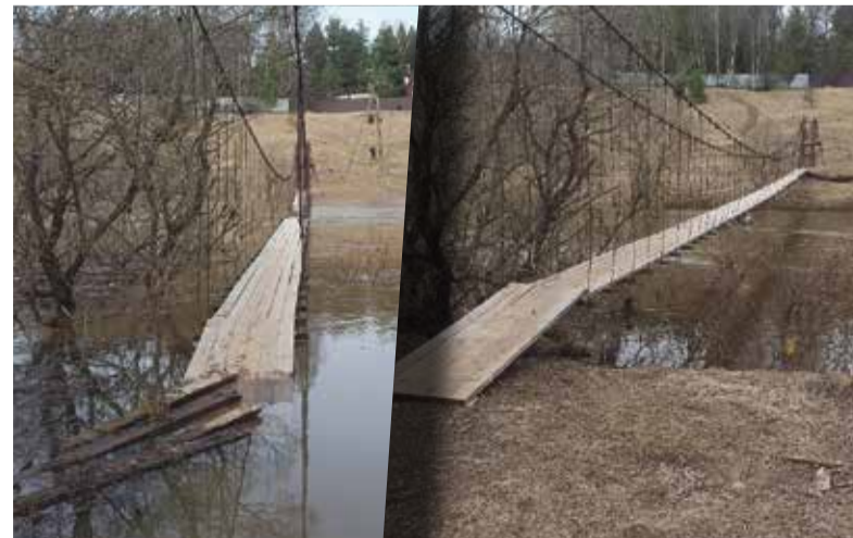
► Переправа в деревне Сатино