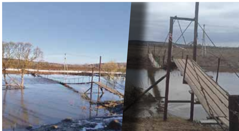
► Подвесной мост в деревне Новомихайловское

Все это вызывало смутную тревогу. Сотрудники МЧС пророчили начало половодья в последние дни марта, и их прогноз действительно оправдался. Вода начала прибывать стремительно — в том же