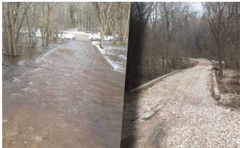
► Дорога на деревню Павлово