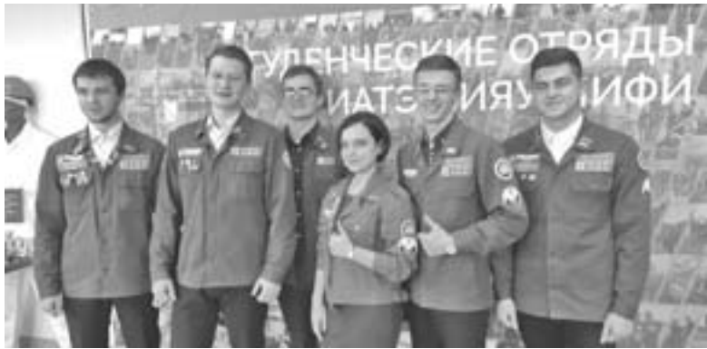
Окончание. Начало на стр. 6