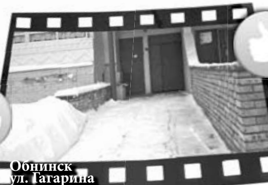
Обнинск ул. Тагарина