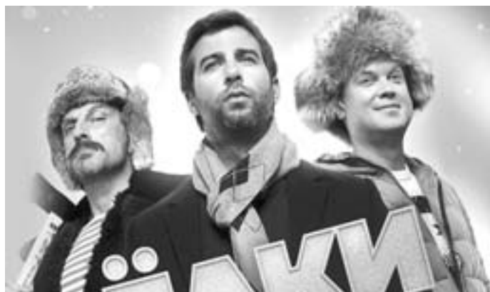
На правах рекламы. Все цены действительны на момент публикации.

11, 12, 13, 14, 15, 16 января в 11-45 – Мультфильм «СНЕЖНАЯ КОРОЛЕВА: ЗАЗЕРКАЛЬЕ» 3D (Россия), 6+.