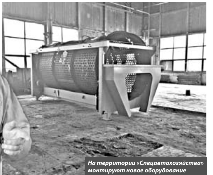
На территории «Спецавтохозяйства» монтируют новое оборудование

А учитывая, что полигон областного центра также использовал все свои мощности, технопарк будет вполне уместно смотреться и вблизи Калуги.