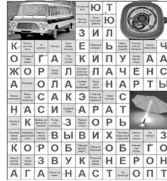
Ответы на сканворд № 25(686) от 04.07.2019