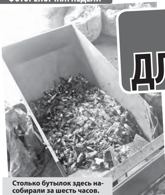
Столько бутылок здесь собрали за шесть часов. Всего за сутки набирается около 4-5 тонн стекла.