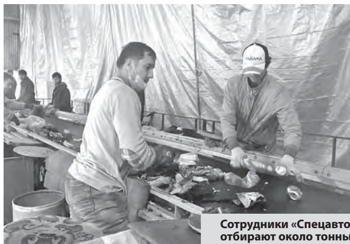
Сотрудники «Спецавтохозяйства-Обнинск» отбирают около тонны металла в сутки.