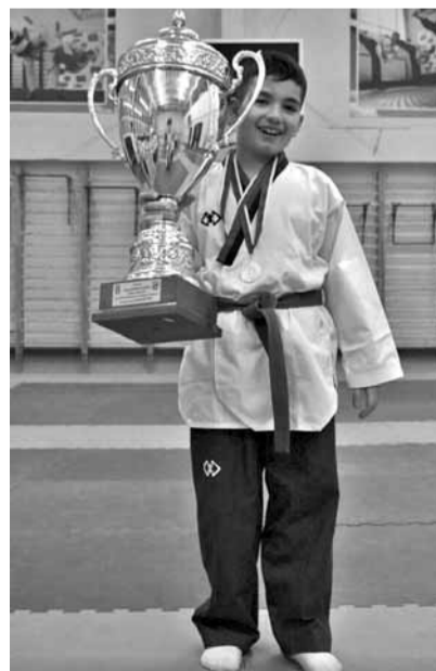
Внуки уже несколько лет ждут возвращения своей бабушки...