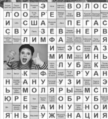
Ответы на скандворд № 13(724) от 09.04.2020