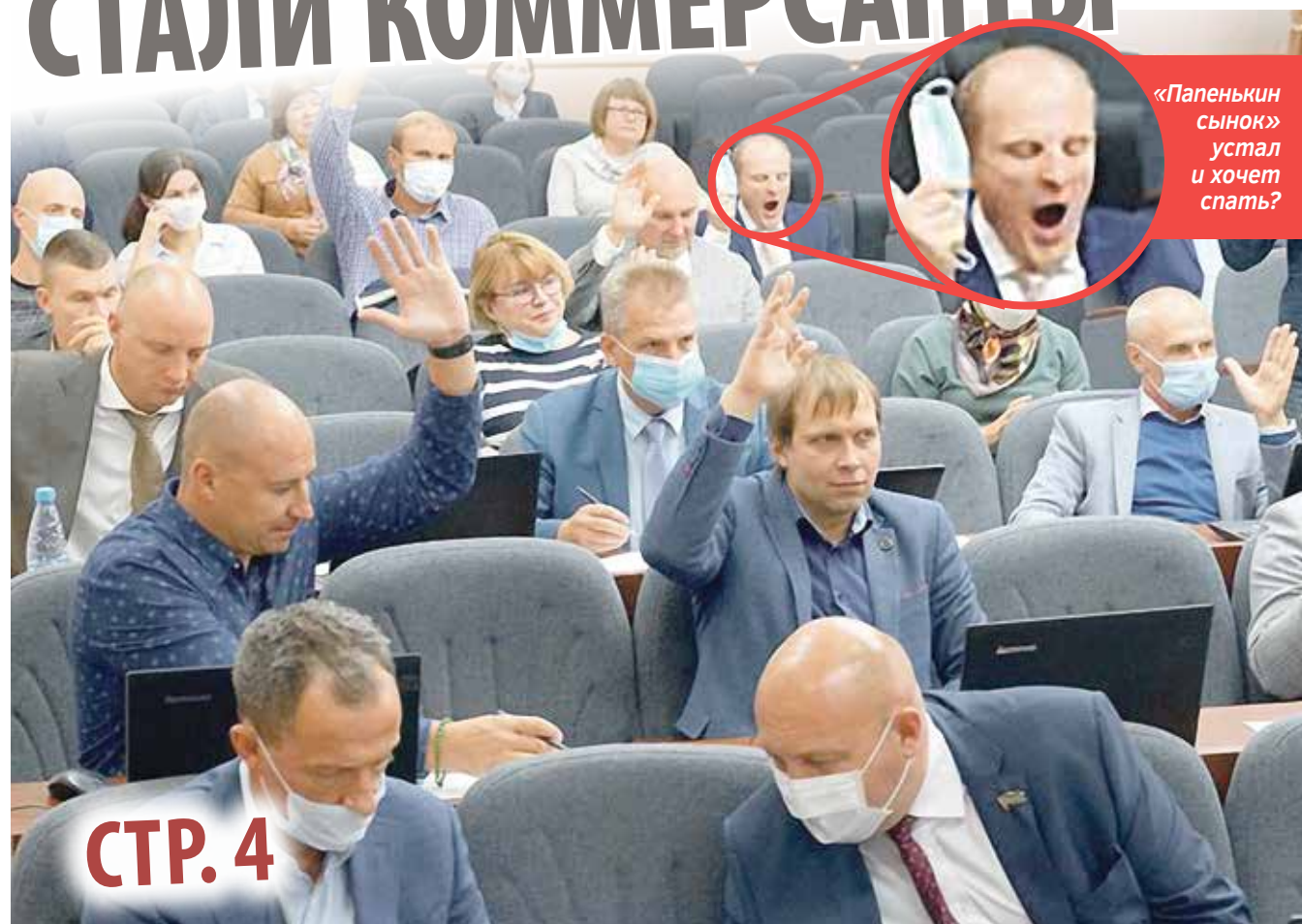
«Папенькин сынок» устал и хочет спать?