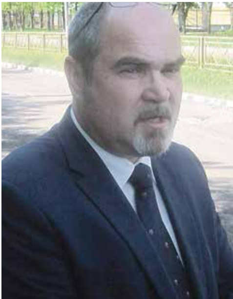
■ Вячеслав ЛЕЖНИН

Губернатор Владислав ШАПША подписал Постановление о формировании нового состава Правительства Калужской области.