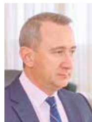
► Владислав ШАПША

— Зарегистрироваться могут все граждане РФ, в том числе и жители Калужской области. Чтобы выбрать наиболее достойных, кто в последующем будет представлять наш регион в качестве кандидатов в депутаты на выборах в Государственную Думу РФ в Единый день голосования 19 сентября 2021 года, — добавил глава региона.