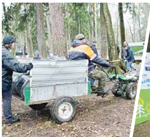
➤ Спецтехника спешит на помощь...

Но, как говорят специалисты, вероятность того, что птицы сделают еще одну кладку в течение этого года, крайне мала. Тем не менее, с главной задачей — сохранить пару аистов — справиться удалось.