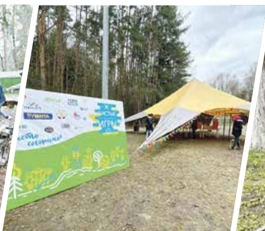
➤ На «Чистых играх» была развернута платка с музеем эко-предметов