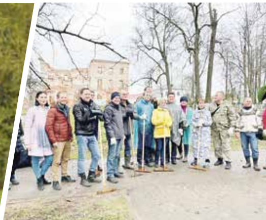
➤ В Белкинском парке убрали всю прошлогоднюю листву