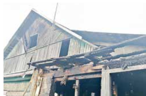
► Этот дом надо разобрать