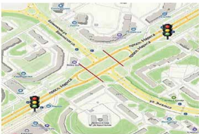
Организация дорожного движения по пр. Маркса от д. 71 до д. 83

Предвосхищая негодование граждан по поводу ликвидации «зебр», справедливости ради надо сказать, что взамен за последние два года в Обнинске нарисовали 10 новых пешеходных