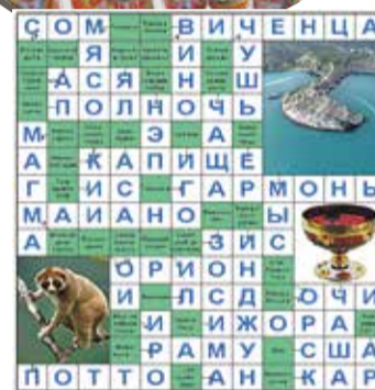
Ответы на сканворд № 3 (815) от 27.01.2022

УСЛОВИЯ КОНКУРСА ОСТАЮТСЯ ПРЕЖИМИ Необходимо подсчитать количество гласных и согласных букв («й», «ь» и «ъ» мы считаем согласными), а также ответить на вопросы по актуальным темам номера. Звоните в редакцию по тел.: 8-906-784-81-61 в понедельник с 11 до 12 и выигрывайте. ПРИЗ МЫ ДОСТАВИМ НА ДОМ БЕСКОНТАКТНЫМ ПУТЕМ!